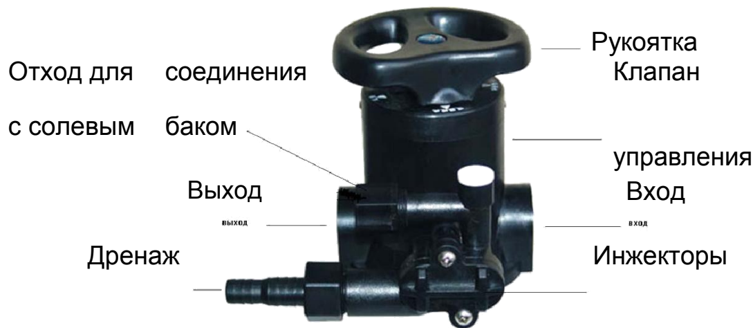
Таблица № 1.